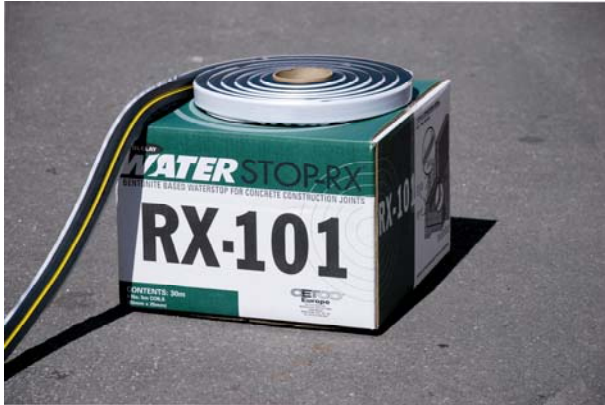
Waterstop RX-101 är ett självinjekterande fogband...