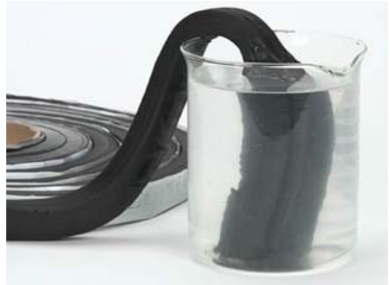
...som tätar i kontakt med vätska.